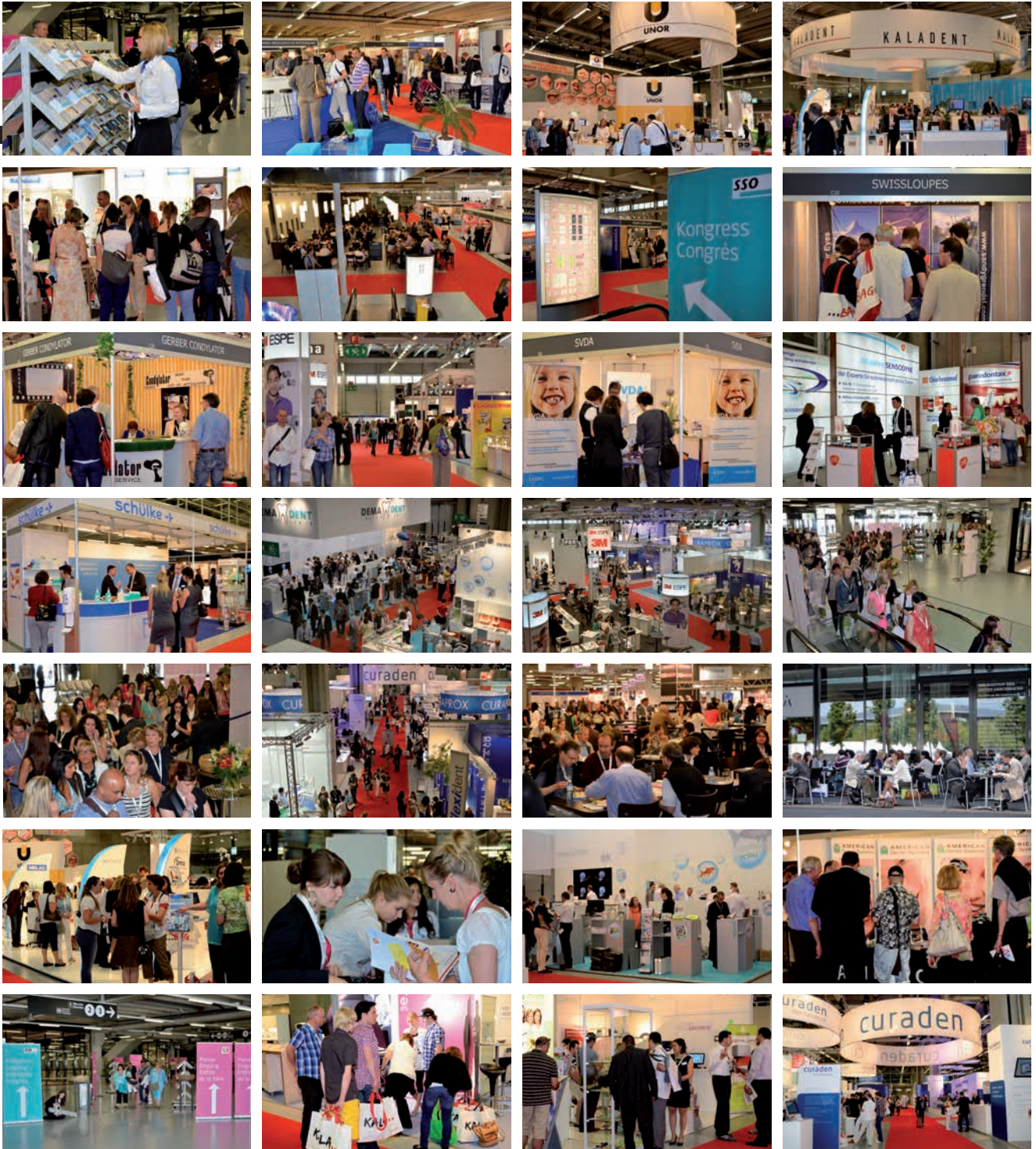
IMPRESSIONEN DENTAL 2018